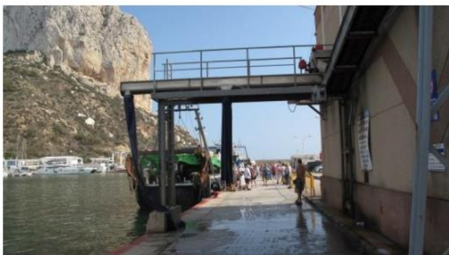
Havnen med litt av Calpe-klippen i bakgrunnen. I Calpe overvar vi også fiskeauksjonen – uten at våre bud vant fram (se bilde under)