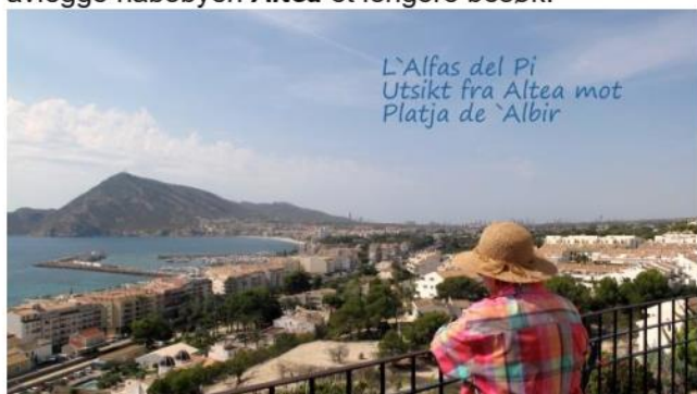
L'Alfas del Pi Utsikt fra Altea mot Platja de Albir

Torsdagen som var til fri disposisjon skulle vise seg å bli den varmeste på hele turen – med godt over 30°. Noen tok beina og den flotte strandpromenaden fatt for å avlegge nabobyen Altea et lengere besøk.