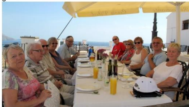
På Casa Vital i gamlebyen inntok noen av oss dagens lunch

På det høyeste punktet ligger kirken. Og hvis du tenker deg kirkeplassen som et nav, løper trange brosteinlagte gater på kryss og tvers nedover åsryggen med hvitkalkede hus vegg-i-vegg. Mange av disse husene er gjort om til gallerier, kunstverksteder og gourmetrestauranter.