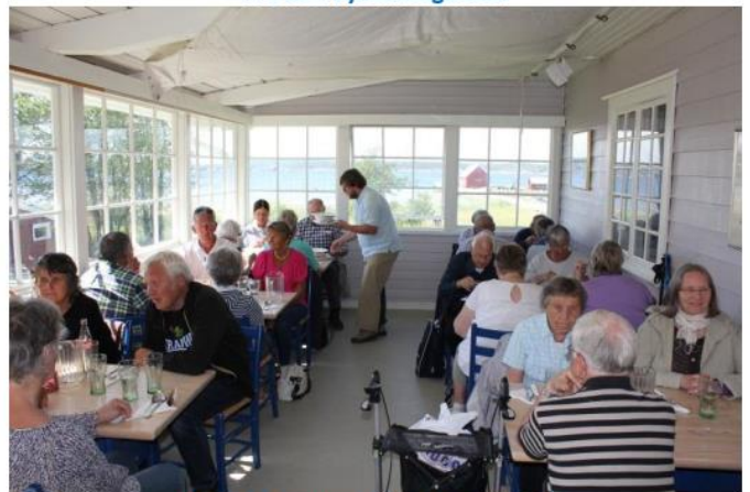
Deilig fiskesuppe på Haga Kystkafé