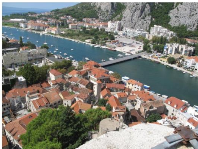
Den tidligere sjørøver- nå raftingbyen Omis

som gjelder. Vi valgte imidlertid et rolig båtcruse på elva Cetina inklusive en bedre lunsj langs elvebredden.