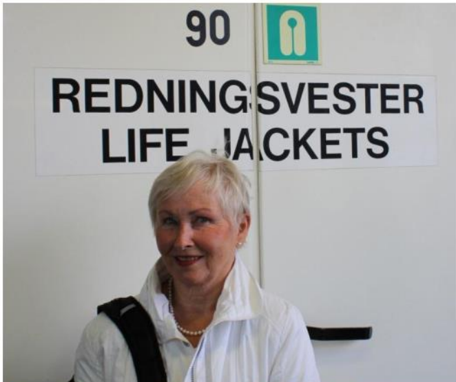
Åsne sjekket nøye at det var tilstrekkelig antall redningsvester om bord på ferja