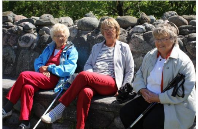
Muligheter for hvile underveis