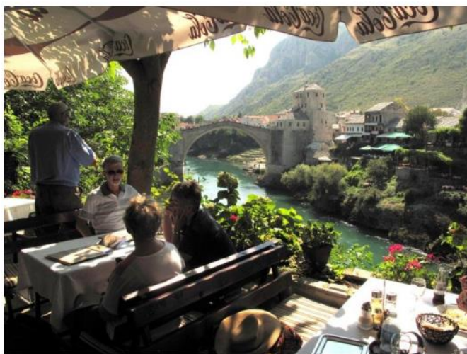
Nyter lunsjen mens vi skuer mot Stari Most

Tirsdagen var opprinnelig avsatt som fridag, men et 20-tall av oss valgte likevel en ekstrautflukt til byen Mostar i Bosnia-Hercegovina. Og det ble en dag med sterke opplevelser. Underveis fortalte vår engelsktalende bussguide inngående om natur og folk i dette sterkt krigsherjede landet. Med sine ca. 5 mill innbyggere fordelt på 3 offisielle språk, 2 skriftspråk og 3 hovedreligioner ligger mye av kimen til den ulyksalige borgerkrigen som ved krigens slutt i 1995 hadde resultert i over 100.000 døde og ca. 2,5 mill fordrevet på flukt. I Mostar møtte vi nok norsktalende guide av første klasse. Marija – oppvokst på Gran på Hadeland – loset oss gjennom sin kjære hjemby på beste vis. Mostar med sine 113.000 innbyggere er for øvrig kjent som en av de varmeste byene i Europa – noe vi fikk bevist til fulle. Byen har sitt navn etter Stari Most = Den gamle bro som ble bygget på 1500-tallet og krysser elva Neretva .