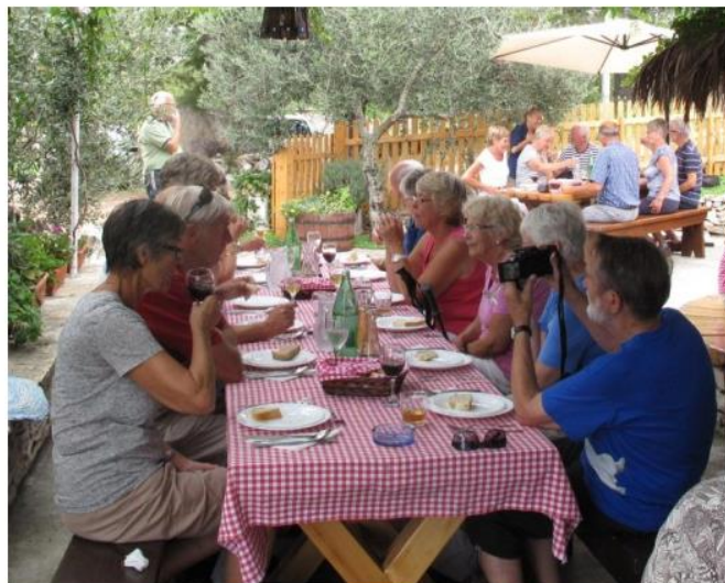
Fra en av de mange lunsjer vi satte til livs

Broa og det historiske området rundt, var av både av serbiske og kroatisk nasjonalister sett på som en del av den bosniske og islamittiske kultur. I 1993 ble broa bombet og falt sammen, men er seinere blitt gjenoppbygget med støtte fra Unesco. Ellers stod både moské, museum og en lengere spasertur i gamlebyen på dagsorden denne flotte dagen.