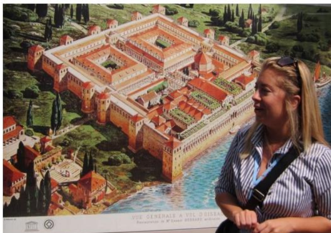
Bilde av Det Diokletianske Palass

med lang og bred strandpromenade med utallige restauranter og butikker som selvfølgelig ble besøkt.