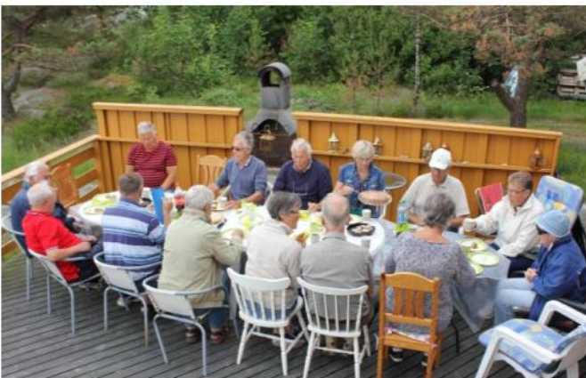
Årets rekefest samlet 20 medlemmer

Det er ei lita badestrand i bukta ved hytta. Her er fint å gå ut å bade for både store og små. Ved den store brygga som hører til hytta er det egen båt som ligger på vannet i perioden mai - september. Her kan det ypperlige fiskemuligheter både fra båt og fra svaberget mot Nidelva.