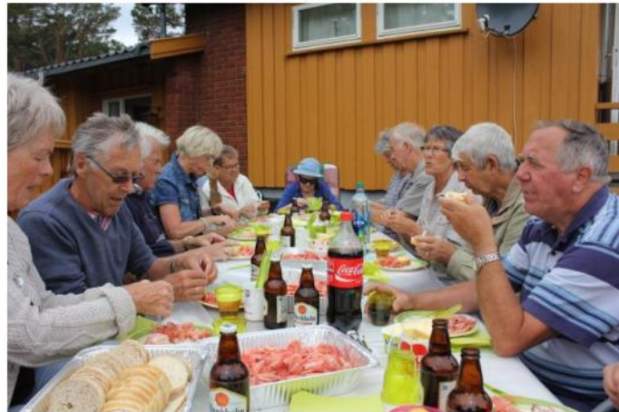
Når postfolk samles blir det gjerne litt "husker du" - fra gylne tider i Posten