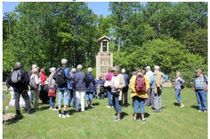
Fra den nye kirkegården