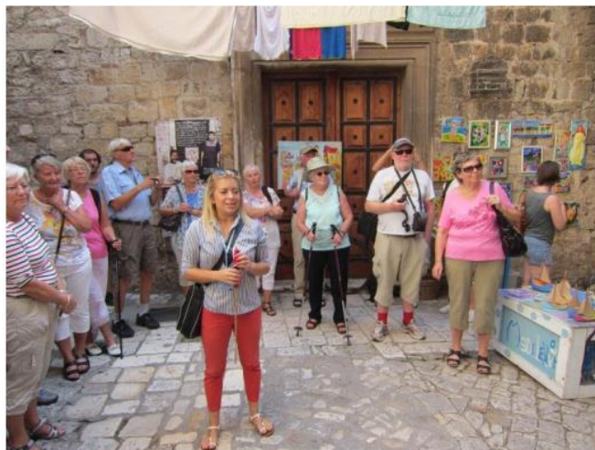
En fornøyd flokk i idylliske Trogir

Koselige Trogir lå inne i mandagens program. Med sine 11.000 innbyggere har byen små broer som binder den historiske gamlebyen sammen med resten av byen – ofte omtalt som Kroatias svar på Venezia . Byen som ble grunnlagt i år 300 f.kr har en lang og broket historie med vekst, forfall, krig, beleiringer og skifte av eiere. Bygnings-massen er så kompakt at hele øya ser ut som en fest-ning. I 1997 ble den en del av Unesco's verdensarvliste. I tillegg til kultur var det også rikelig med butikker og restauranter.