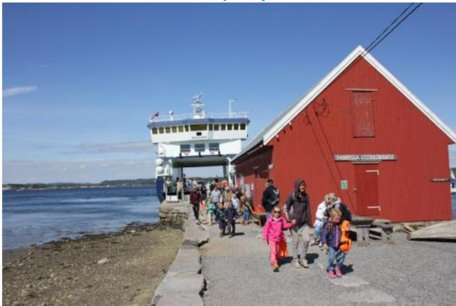
Vi ankommer Tårnbrygga