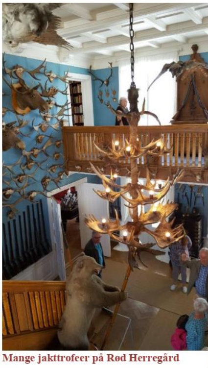
Mange jakttrofeer på Rød Herregård

Vel tilbake på landsiden bar det nedover mot Sarpsborg og Quality Hotel der vi skulle bo de neste to nettene.