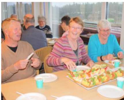
Glade aust-egder klar for de fantastiske rundstykkene

Man kan si hva man vil om vanlige årsmøtesaker , men stemningen steg til nye høyder da noen gedigne rundstykker og kake med tilhørende kaffe og te kom på bordet. Og alle var enige om at det hadde vært et godt møte.