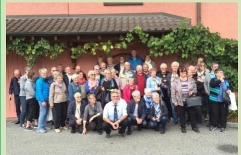
Turdeltakere og guider