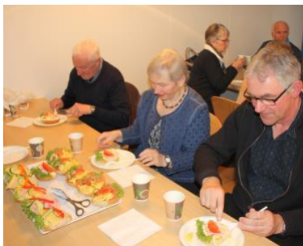
Glade vest-egder synes aldri det er feil med verken reker, røkelaks eller skinke/ost