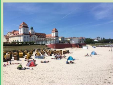
Bilde fra Rügen