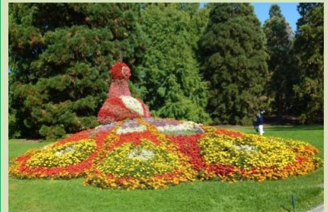
Fra blomsterøya Mainau

Styret vil avslutningsvis takke medlemmene for interessen og tilliten i 2016.