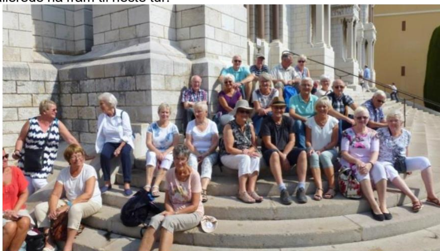
Tekst: Hildegunn Usterud / Bilder: Bjørn Usterud, Petter Wilhelmsen og Jørgen Sørensen