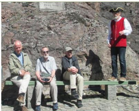
Utendørs historietime på festningen

I 1718 ble det forberedt et nytt innfall i Norge, og i desember ble kongen skutt på Fredriksten festning.