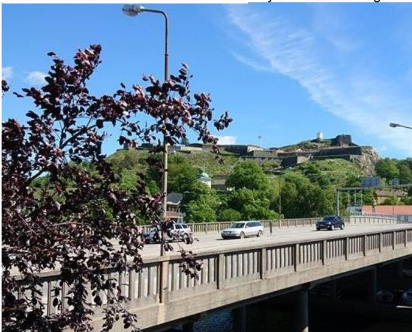
Fredriksten Festning kneiser høyt over Halden by

Etter festningsbesøket fikk vi et par timer til fri benyttelse i Halden, før vi satte kursen mot hotellet igjen til litt avslapning og ny 3-retters middag.