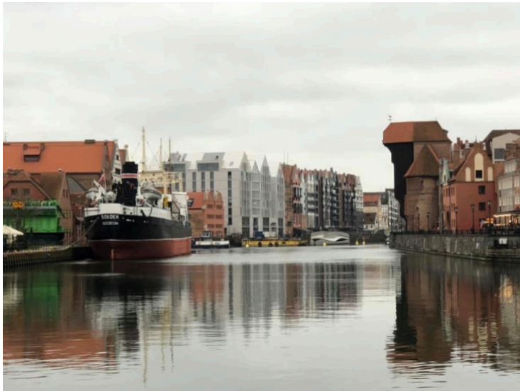
Trivelig langs havnepromenaden hvor den gamle kranbygningen fra 1300-tallet ruver.