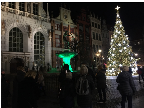
Omvisning i Gamlebyen.