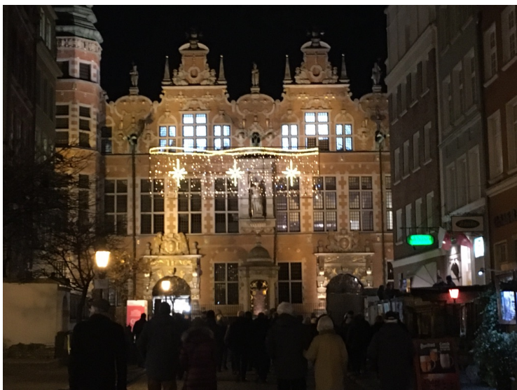
Denne vakre bygningen i Gamlebyen, oppført i 1605, var opprinnelig et våpenlager.