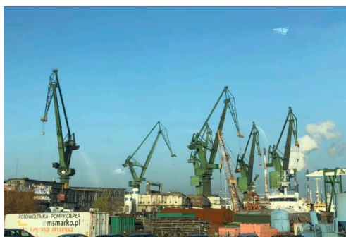
Verftsindustrien preger fortsatt havnen i Gdansk.