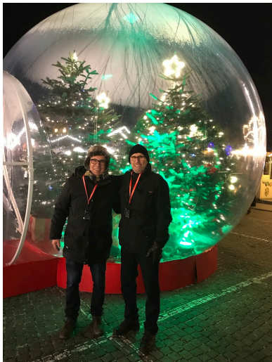
Fornøyde var også turkomiteen.