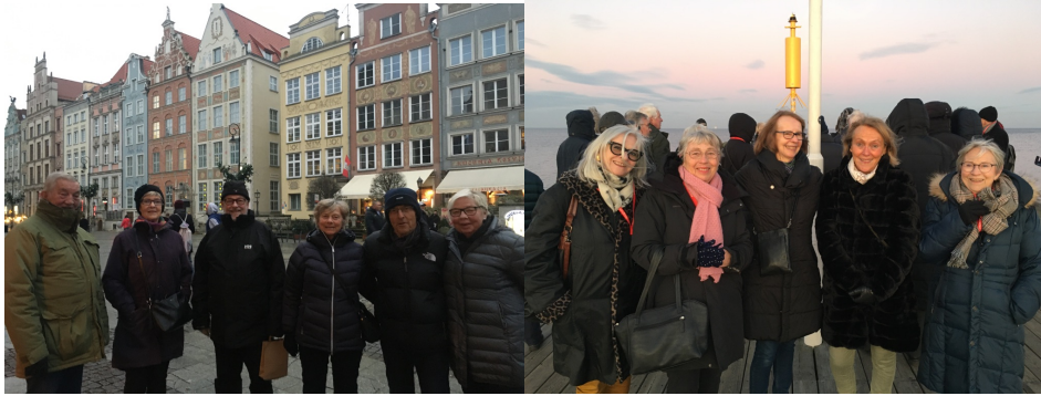
Blide og fornøyde turdeltakere.