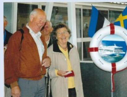
Estland i 2005