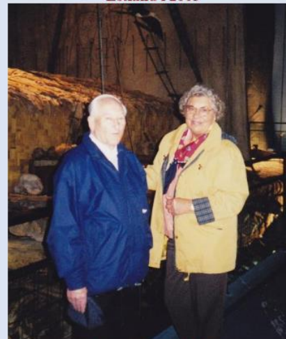
Oscarsborg i 2002