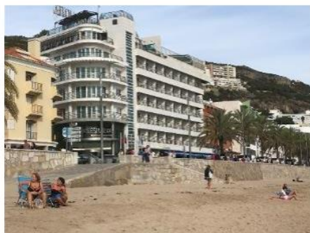
Hotel Sana Sesimbra

er en liten fiskerby ved foten av borgen Castelo de Sesimbra fra 1200-tallet. Byen har ca. 6.000 innbyggere, men dette 3-4-dobles i sommermånedene. Stedet ble vår hovedbase for den 8 dager lange turen.