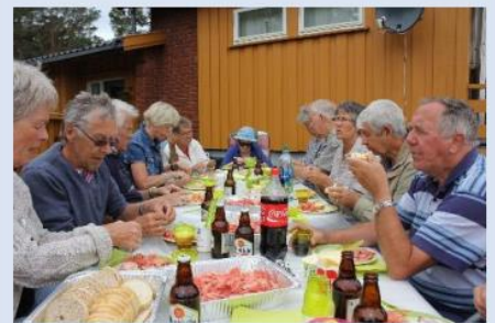
Rekefest på Klausa