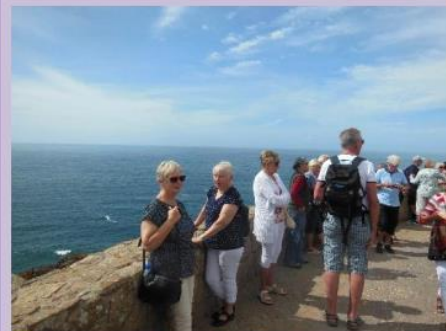
Capo de Roca

Onsdag var siste dag før avreise. Flere av deltakerne benyttet anledningen til å utforske borgen som lå høyt over Sesimbra , mens andre dro på egenhånd tilbake til Lisboa . Se noen bilder på neste side