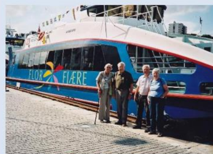
Flor og Fjære i 2006

En spesiell takk i den forbindelse går til alle de som i fortid og nåtid har påtatt seg tillitsverv eller andre oppgaver til medlemmenes beste.