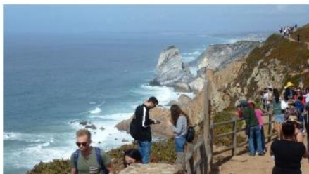
Cabo de Roca – Portugals og Europas vestligste landpunkt