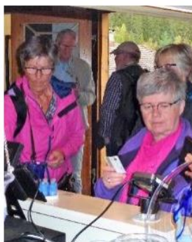
Betalingkortene gikk varme