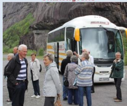
På tur til Sogndalstrand i 2013