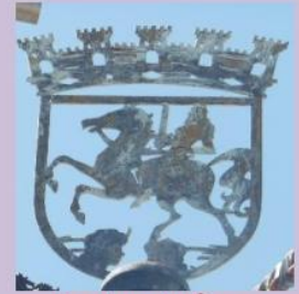
Byvåpenet i Évora

Tilsynelatende skulle ALLE inn i Lisboa sentrum denne dagen. «Alle» omfattet både oss 43 postpensjonister + 4 cruisebåter, hver med 4000 cruiseturister + alle skolebarn og -ungdom som skulle ha