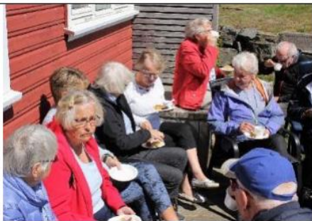
Kaffe og masse gode kaker i solskinnet