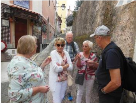
Vi smaker på Licor de Ginja ..

Byen står på Unescos verdensarvliste og sies å være nær verdenstoppen i antall severdigheter pr. innbygger.