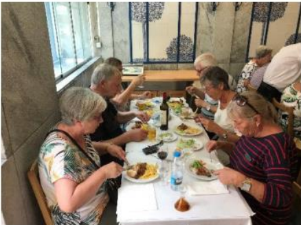
Nydelig kylling til lunch