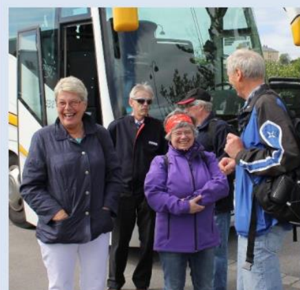
På vei til Jomfruland 2014