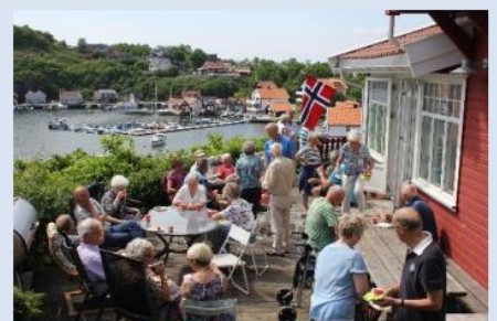
Rekefest på Flekken