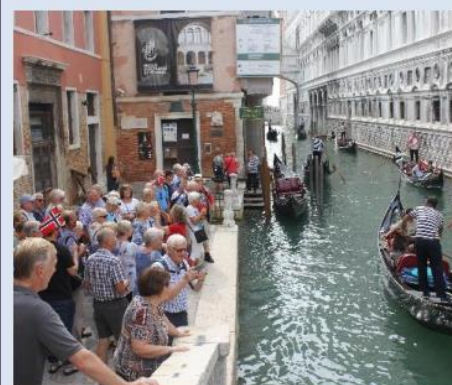
Venezia i 2018