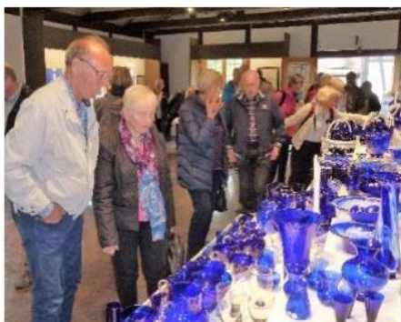
Valgets kval i Den Blaa Butikk