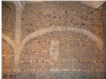
Knokler og hodeskaller fra 5000 personer dekket veggene og søyler

Dagens lunch på restauranten O Parque dos Leitões i Arraiolos ble en flott og ikke minst lystig opplevelse. Ser ikke bort fra at nærmest ubegrensede mengder av sangria, hvitvin, øl og mineralvann gjorde sitt til den høye stemningen. Men både den meget smakfulle tomatsuppen og restaurantens spesialitet – pattegris – la på ingen måte noen demper på stemningen. Heller ikke den søte eplekaka m/kokte plommer.