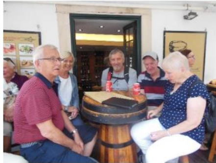
... og andre forfriskninger