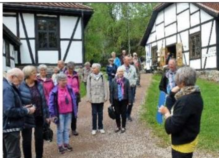
Guiding på Blaafarveverket