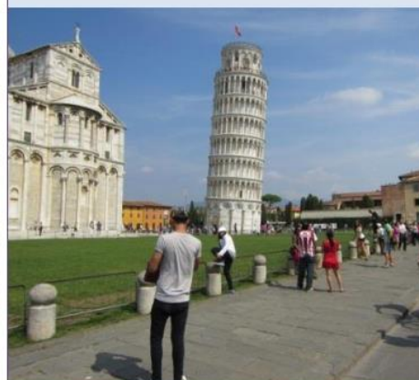
Det skjeve tårn i Pisa 2012