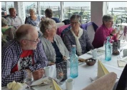
Lunch i Åsgårdsstrand