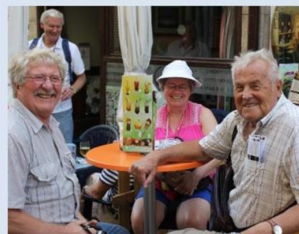
Andalucia i 2013