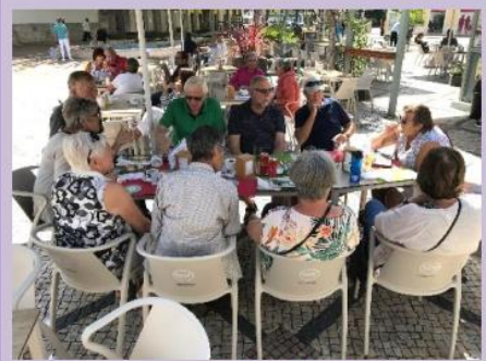
Lunch i Setúbal