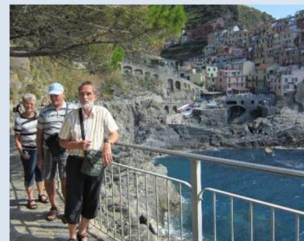
Cinque Terre (Toscana) 2012