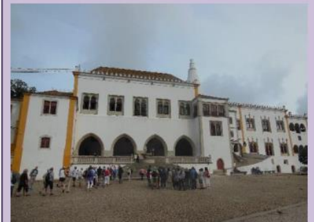
Palacio Nacional de Sintra