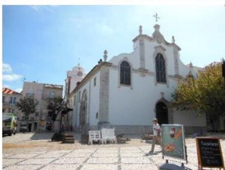
Byen var pyntet i anledning Festa Da Flor