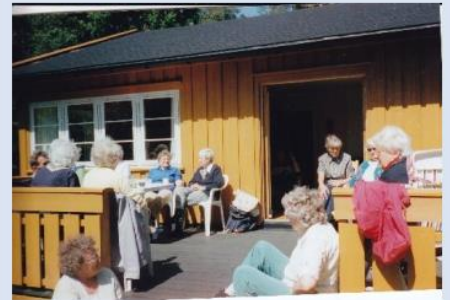
Fra Rekefesten på Gåseholmen i 2000