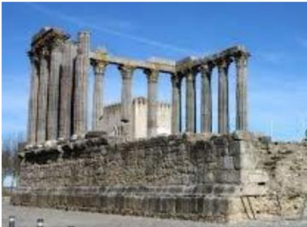
Diana Templo Romano var opprinnelig bygget i granitt og marmor

Évora som ble grunnlagt av romerne og seinere befestet av maurerne, var universitetsby allerede fra 1555. Universitetet var riktignok stengt i 200 år, men ble gjenåpnet i 1975. Restene av det romerske tempel – Diana Templo Romano – var sammen med Capela dos Ossos (Knokkelkapellet i Fransisco-kirken) blant de mest kjente bygningene. Korsfareren Giraldo erobret byen fra maurerne gjennom å gifte seg med kongens datter, men da han hadde inntatt byen, hogg han hodet både av sin nye kone og sin svigerfar. Byvåpenet viser derfor Giraldo til hest med 2 avkappede hoder under hesten.