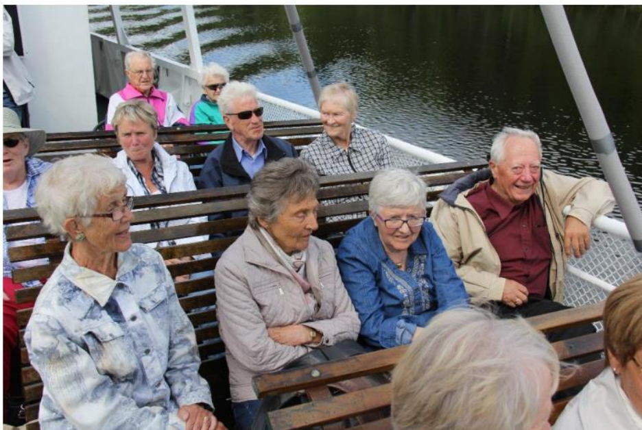
På båttur på Telemarkskanalen (2012)

2018: Den planlagte turen til Danmark (Midtjylland og Fyn) ble avlyst 2019: Blaafarveverket/Modum via Åsgårdstrand 20.-22.5.i – 29 deltakere