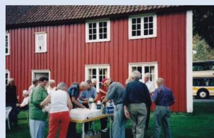
Linsj ved Almuestua i Holt i 2000