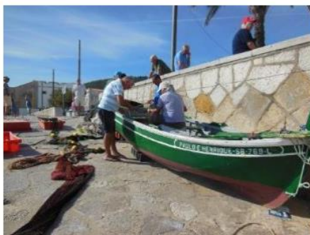
Fiskerne klargjør redskapen

Portugisisk mat består av mye fisk. Portugiserne spiser 55 kg fisk i året – bare slått av japanerne når det gjelder mengde. Halvparten av fiskemåltidene er bacalao som i hovedsak kommer fra Norge. Det finne over 300 ulike oppskrifter på bacalao. Suppe er obligatorisk ved alle portugisiske middager.