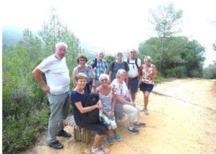
Meget bratt og tung stigning opp til Castelo de Sesimbra