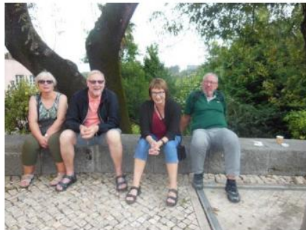
.. mens andre bare slappet av

Neste stopp på ferden var havnebyen Cascais hvor vi hadde deilig lunch på restauranten Don Manolo . Etter lunch var det byvandring på egenhånd. Byen var opprinnelig en festningsby som fra 1600-tallet sloss mot englenderne og pirater fra mange land. Cascais er i dag en fiskerby og ferieby for de litt «finere» fra Lisboa og utlandet. Regnes av mange som en forstad til Lisboa.