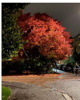
Høstlig hilsen - Det vakre kirsebærtreet i Harald Hårfagresgate i Oslo

Det er vel neppe noen andre enn oss selv som kan bidra i slike prosesser for å sikre at Oslo er en aldersvennlig by.