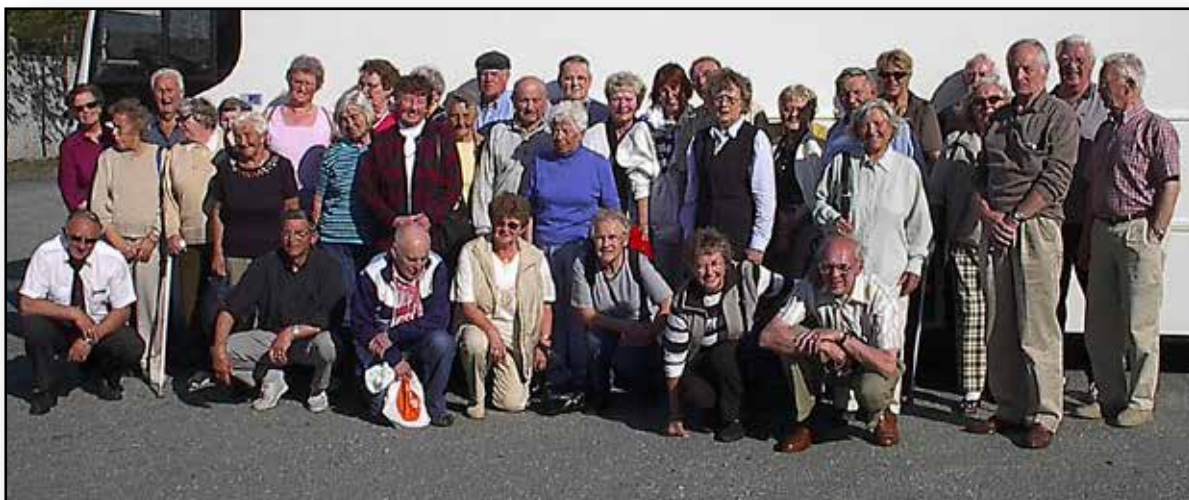
Tur til Ertvågøya 23.05 2003

Det har gått opp og ned med antall medlemmer opp i gjennom årene. I dag teller 150 medlemmer på vår liste.