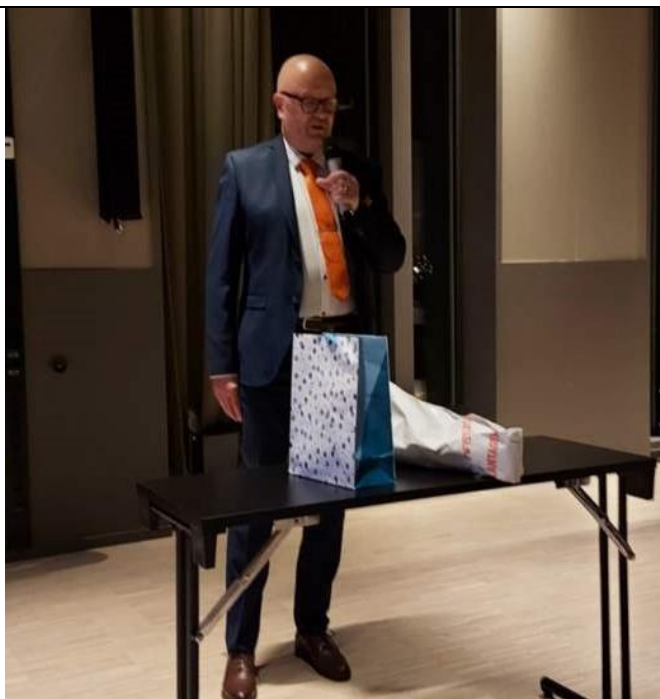
Tidligere leder i Postens Idretts- og Fritidsforbund takket for maten.