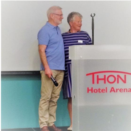
Avtroppende og påtroppende leder

Forbundets økonomi, og handlingsplanen for de neste 3 årene var blant sakene som var oppe til diskusjon.