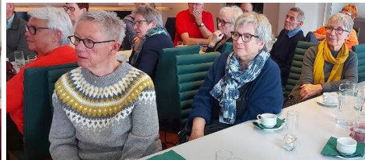
Hamar 6. april