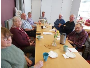
Elverum 30. mars