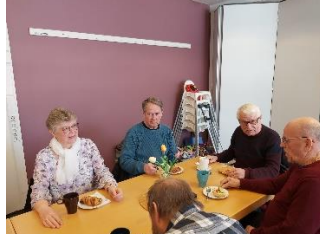
Elverum 20. april