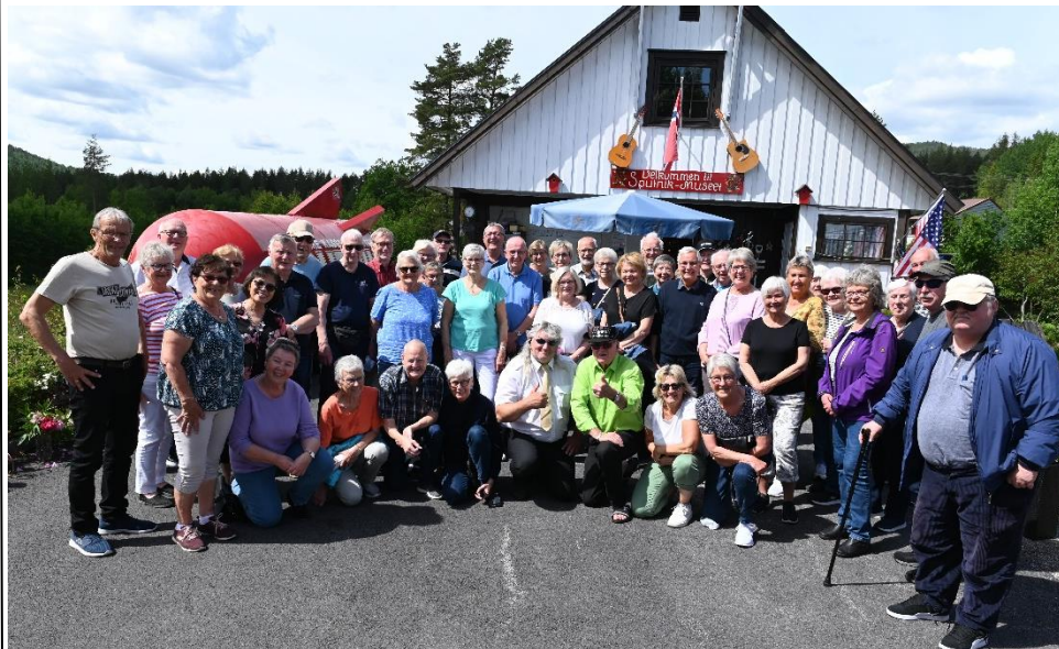
Besøk hos Sputnik 15.juni 2022