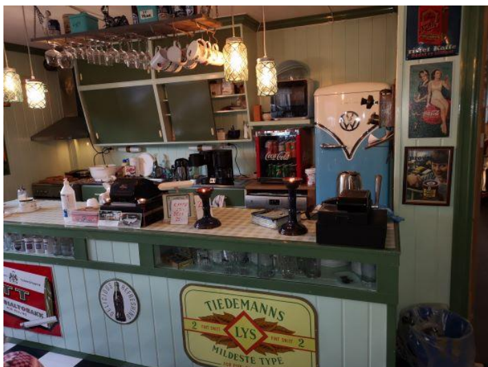
Klipp fra Ådalsbruk motormuseum