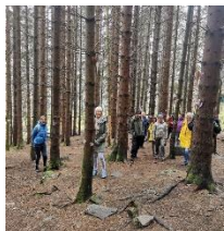
Litt om turen til

Trivselshagen på Sandane , den 12. Mai 2022. Vi møttes på parkeringsområdet til Trivselshagen, og var totalt 18 stk. Været var sånn passe, litt kaldt og tendens til nedbør. Dei fleste av oss gjekk løypa gjennom kjærleiksskogen og vidare til dagsturhytta på Sandane. Det var fleire med frå Sandane og dei var kjempeflinke til å informera oss andre og fortelja om Trivselsskogen. Dessutan traff vi andre lokalkjende som fortalde om korleis trivselsskogen hadde blitt oppbygd. Kjempefint tiltak i eit lokalsamfunn, noko til eksempel for andre tettstader. Til 2 retters middag på Gloppen Hotel var vi 19 stk. Vi fekk nærreist mat, og den var kjempegod Ref. Anna Lunestad