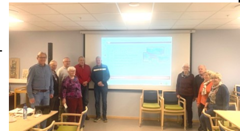
Fra kurset på Lillehammer.

Lillehammer 8. november var det oppfølgingskurs på Lillehammer med 8 deltakere. Som på de andre kursstedene, hadde vi kurset i etterkant av kaffetreffet i samme lokale. Kursene blir i tillegg til litt ny kunnskap også en sosial samling med meningsutveksling og tips.