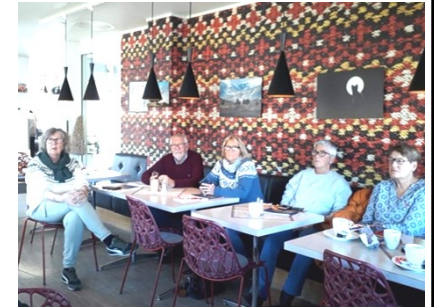
Fra kurset på Dombås den 19.oktober

Dombås 19. oktober med 5 deltakere. Data-sikkerhet og bruk av apper var blant de viktige områdene vi hadde fokus på. Det blir et oppfølgingskurs på Dombås etter nyttår.