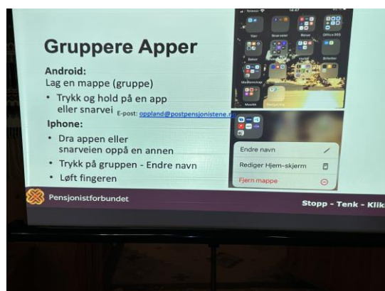
Gruppere apper med egne navn gir god oversikt!

På bildet ser vi noen av deltakerne på Hadeland som har en kaffepause.