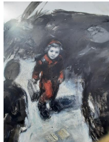
Lille Ellinor, 5 år