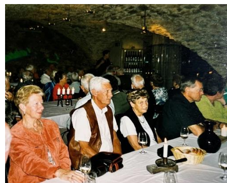
Dette bildet er fra en fellestur i 2004 sammen med Gudbrandsdal og Hedmark til Rüdeshiem i Tyskland.

Gudbrandsdal som var en av naboavdelingene til Vestoppland, fikk forespørsel om vi kunne ta imot medlemmene i Vestoppland. Det sa de ja til og sammenslåingen gikk greit, og etter et halvår var det meste på plass og fungerer godt. Godt vennskap og tidligere samarbeide bidrog nok i stor grad til at dette ble vellykket.