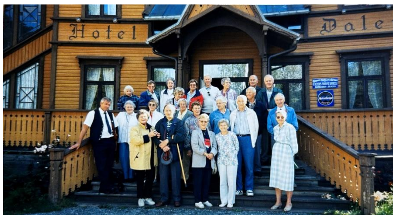
Dette bildet er fra en tur i 1997 og er tatt utenfor Dalen Hotell.

I en gjennomgang av gamle protokoller, gamle bilder m.m. som Vestoppland har tatt vare på, kan vi slå fast at Vestoppland avdeling ble drevet meget godt, og hadde mange fine aktiviteter gjennom mange år.