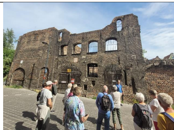
Rester av gammelt kornlager fra 1300-tallet

Dag 3 var vi på utflukt til trippelbyen Gdansk, Sopot og Gdynia, som bindes sammen med en 25 km lang hovedvei. På vei ut av Gdansk kjørte vi langs Polens eldste og lengste lindetreallé på 2 km. Første stopp var Oliwakatedralen, hvor vi fikk overvære en mektig orgelkonsert.