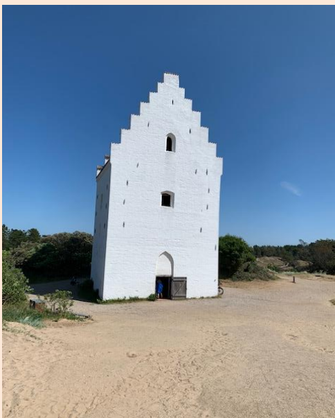
Den tilsandede kirke i Skagen