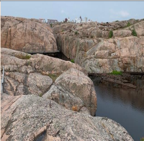
Dei underlege svaberga i Smøgen