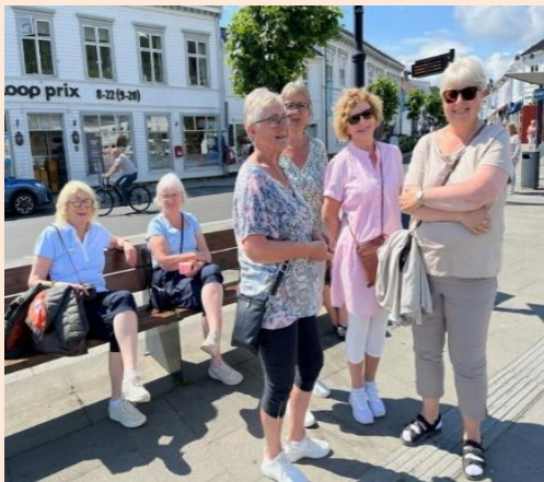
Turdeltakarar som på eigenhand koser seg i sola

Grasrotandelen er på 7%. Vi har 5 gjevarar som har utløyst kr. 4.775 i tilskot så langt i 2023. Vi håpar sjølvsagt på fleire gjevarar som igjen vil auka tilskotet