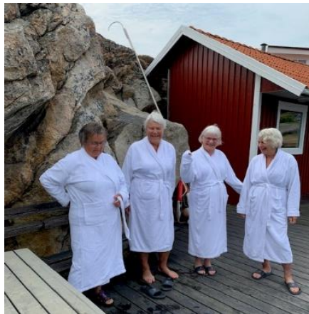
Posten sitt svar på «Svanesjøen»

fann me oss lunsjplasser på egenhand og nytte stemninga ved kaikanten i den koselige vesle byen.