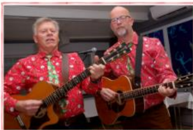
«Ole Terjez» sto for en kjempegod underholdning.