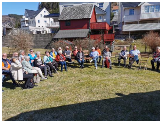
Gjengen samla i Jakob Sande senteret

Etter 1 time vandring i fint vær, kørde vi i kolonne til Dale og Jacob Sande senteret. Her fekk vi servert eit nydeleg måltid som laget betalte, og etterpå ei guida omvising. www.fjordnorway.com/no/se-og-gjore/jakob-sande-tunet