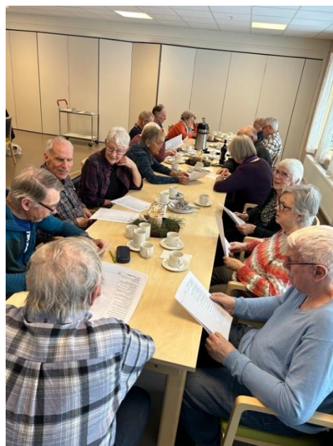
På bildene ser vi noen av lagene som jobber på høytrykk for å diskutere seg fram til rett svar!